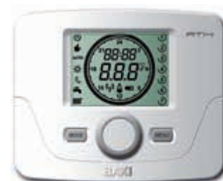
Termostato modulante programable

También existe la posibilidad de crear un pack de alta eficiencia energética, combinando la caldera con la energía solar térmica, consiguiendo así un ahorro superior en la factura energética.