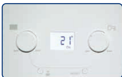
Cuadro de control

Además, la pantalla retroiluminada que integra permite ver el estado de la caldera y los principales datos de funcionamiento como temperaturas o posibles códigos de anomalía.